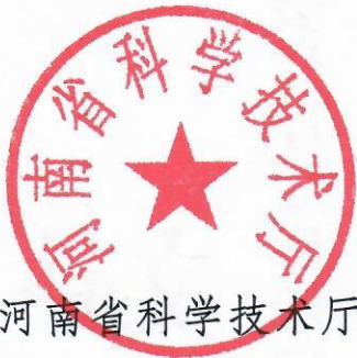
河南省科学技术厅