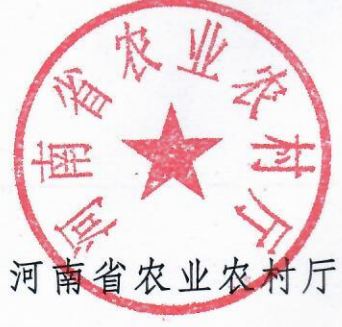
河南省农业农村厅