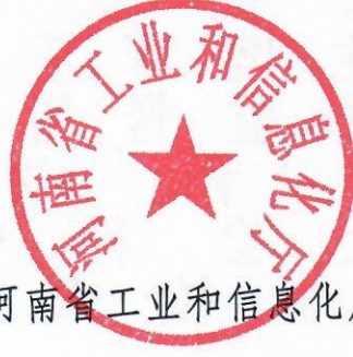
河南省工业和信息化厅