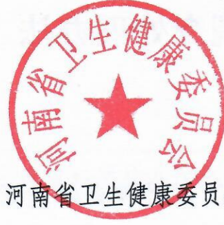
河南省卫生健康委员会