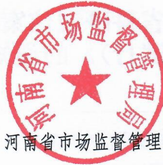
河南省市场监督管理局