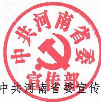
中共河南省委宣传部